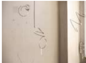
PROSTORNI CRTEŽ (SPACE DRAWING), 1990, žica (wire), Künstlerhaus Bethanien, Berlin