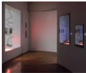
PROSTORNI CRTEŽ (SPACE DRAWING), 2011, bakar, mjed, aluminij (copper, brass, aluminum), MUO, Zagreb