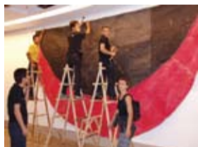
CRVENA (RED), 2005, THE SECOND BEIJING INTERNATIONAL ART BIENNALE, Peking