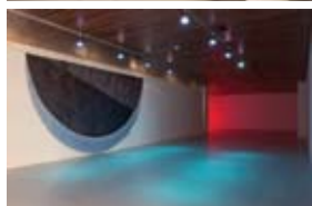
AKVAREL (WATERCOLOUR), 2004, 450 x 450 cm, akril/platno (acryl/canvas), Galerija umjetnina, Split